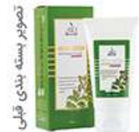
تصویر بسته بندی قبلی