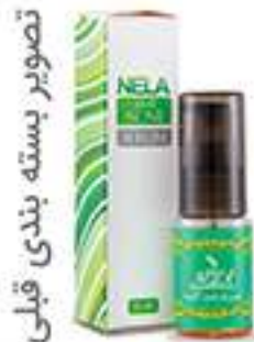
تصویر بسته بندی قبلی

عصاره هسته تمبر هندی، رتینول (ویتامین A) و سایر ترکیبات