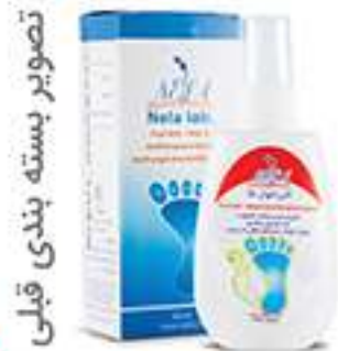
تصویر بسته بندی قبلی